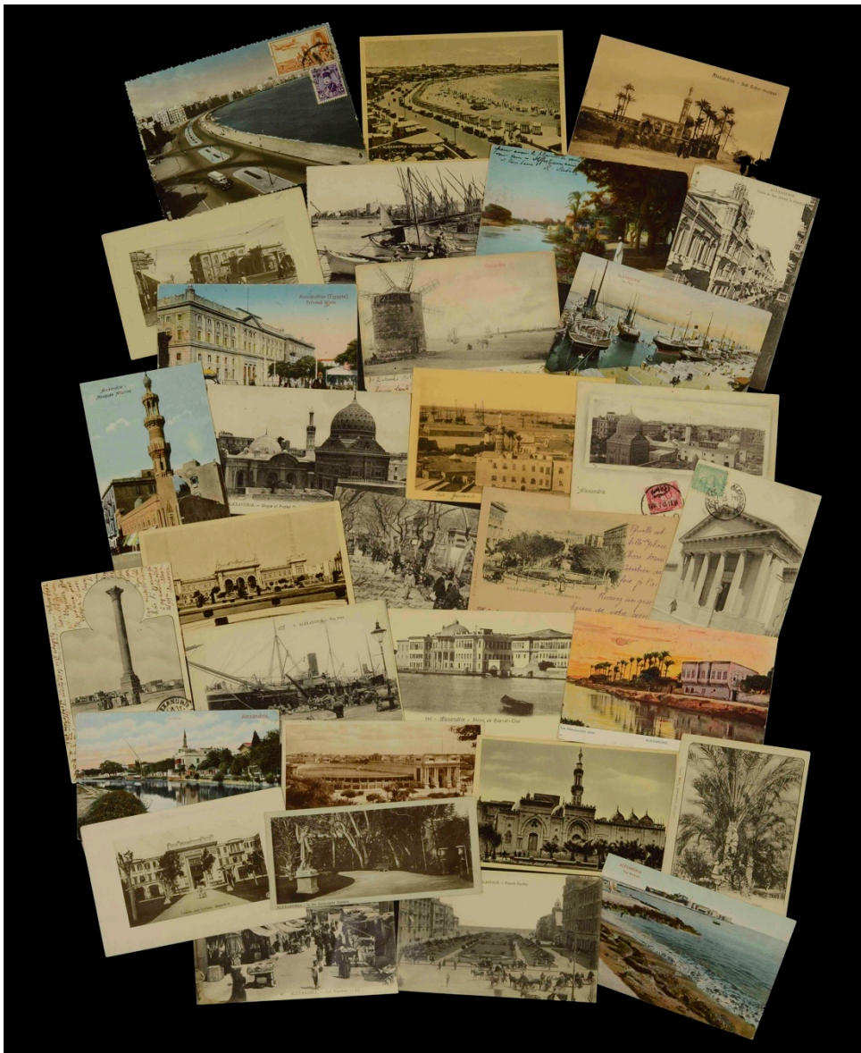
Sélection de cartes postales de la collection du CEALex.

Le CEALex a, dans le cadre du programme Bibliothèques d'Orient, effectué une sélection thématique portant sur Alexandrie (cartes anciennes, estampes, cartes postales, guides de la ville) et a également mis en exergue deux périodiques francophones égyptiens Images (Le Match de l'Égypte du XX e siècle) et la revue féministe l'Égyptienne , qui font partie des collections de presse francophone du CEALex, objet d'un programme de collecte, documentation, numérisation et mise à disposition depuis 2004 (voir http://www.cealex.org/pfe/ ) L'expérience menée avec la BnF nous a amené à souhaiter continuer la numérisation et la documentation de notre fonds de cartes postales sur Alexandrie qui comprend 1 500 individus. Elles montrent la ville et ses bâtiments à différentes époques entre 1890 et 1945, avec un âge d'or qui, comme ailleurs, se place entre 1890 et 1914. Les cartes sont le plus souvent sur un format proche de celui d'aujourd'hui (14 sur 9 cm) ; parfois aussi dans un format plus petit et allongé (15 sur 7 cm). Elles se présentent soit de manière individuelle, soit comme une unité d'une série numérotée qui peut être réunie en album (souvenir touristique) ou bien vendue à l'unité. La photographie initiale, parfois issue des studios connus de l'Égypte de cette époque se décline chez différents éditeurs en divers formats, qualité de support, utilisation du noir et blanc ou colorisation.