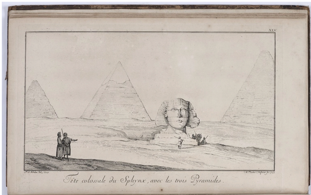
Norden, Frederik. Travels in Egypt and Nubia . London, 1757