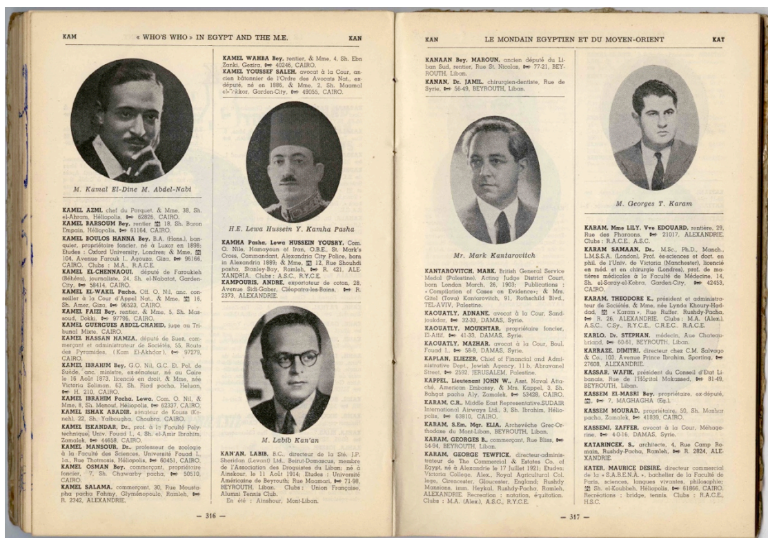
Couverture et extrait du Mondain égyptien et du Moyen Orient de 1948.